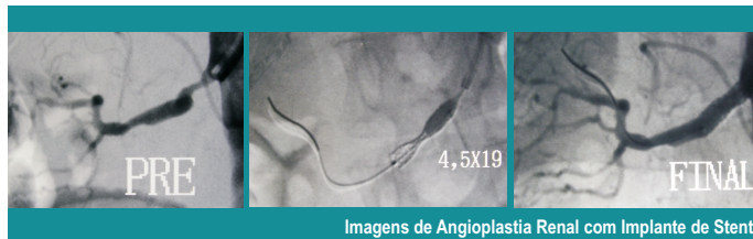
Imagens de Angioplastia Renal com Implante de Stent

Vantagens da Cirurgia Endovascular | Procedimento minimamente invasivo Procedimento sem incisões Recuperação mais rápida Menor tempo de hospitalização Menor risco de infecção Permite que pacientes sem condições clínicas para cirurgia convencional, sejam tratados